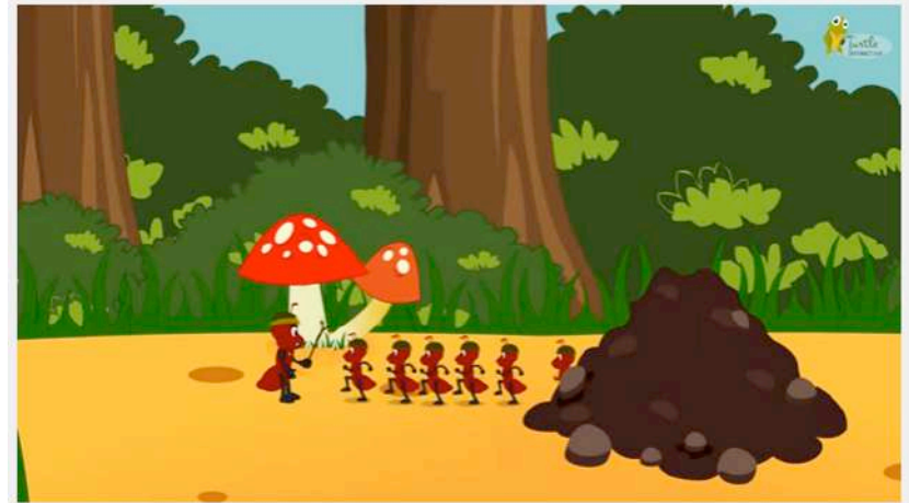
The ants go marching one by one song

https://www.youtube.com/watch?v=Pjw2A3QU8Qg